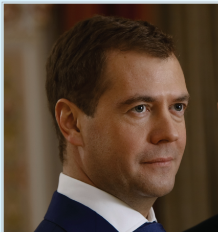
Дмитрий Анатольевич Медведев