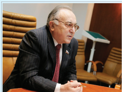
Хусейн Джабраилович Чеченов

Председатель комитета Совета Федерации по образованию и науке